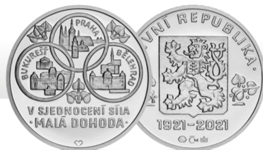
Dvoudukát průměru 25 mm

Téma dukátu bylo autorovi v jistém smyslu velmi blízké. Sice ve své době neutíkal z rozpadající se země, ale změna lokality a náhled na ruskou kulturu zvenci v něm vyvolaly inspiraci k vytvoření návrhu medaile. Po detailním zkoumání tématu si ke zpracování vybral čtyři atributy: orlici Ruského impéria, vlajku se třemi pruhy, kterou měli v odznaku uprchlíci z Ruska, mapu Československa a lipové listy. Útěk Rusů z impéria a přijetí Československou republikou znázornil pomocí pruhů na reverzní straně. Pruhy vycházejí z rozpadající se orlice a míří do mapy. Dále se tento prvek objevuje na averzní straně kolem Lva a kopíruje spodní část štítu. Sjedením pruhů a štítu chtěl vyobrazit spojení Čechoslováků a Rusů. Na obou stranách jsou vyobrazené lipové listy a kromě významu státní symboliky vyzařují i hodnoty klidu a míru, za nimiž uprchlíci přicházeli do Československa.