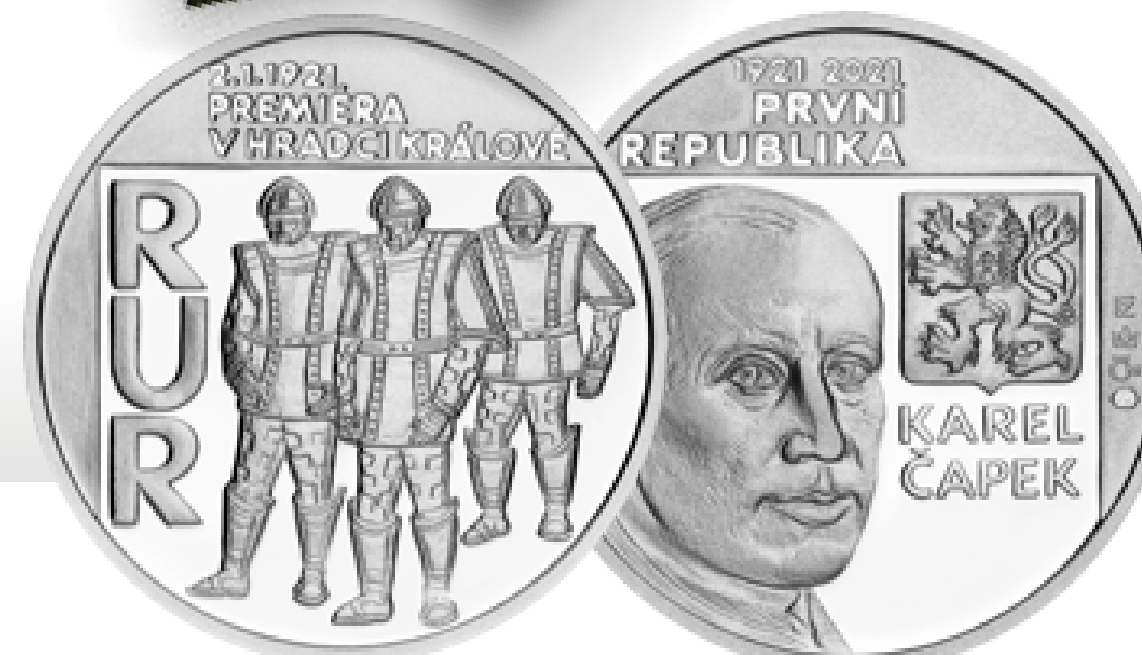
Pětidukát průměru 34 mm

Po konci 1. světové války hrozilo ve Střední Evropě nebezpečí lokálního vzplanutí konfliktu. Po rozpadu Rakouska-Uherska vznikly malé nezávislé státy, jež se cítily ohroženy od dvou zemí, které jediné měly v minulosti výsadu být uváděny v názvu říše Habsburků. Proto Francie iniciovala mezinárodní obranný pakt tří zemí, Československa, Rumunska a Jugoslávie nazvaný Malá dohoda. Trval v období 1921-1939. Dvoudukát ke stému výročí vzniku Malé dohody je navržen tak, aby vyváženě reflektoval historickou realitu. Scénář averzu byl víceméně daný. Na reverzu se uplatnilo heslo spojenců V SJEDNOCENÍ SÍLA a architektonické dominanty tří hlavních měst zemí paktu. Ty jsou ohraničeny vzájemně propojenými kruhy symbolizujícími jednotu a provázanost. Československo bylo vůdčí silou paktu, což bylo dané i úrovní jeho ekonomiky a zbrojního průmyslu. Na rozdíl od svých dvou spojenců si také udrželo demokratický režim až do začátku 2. světové války.