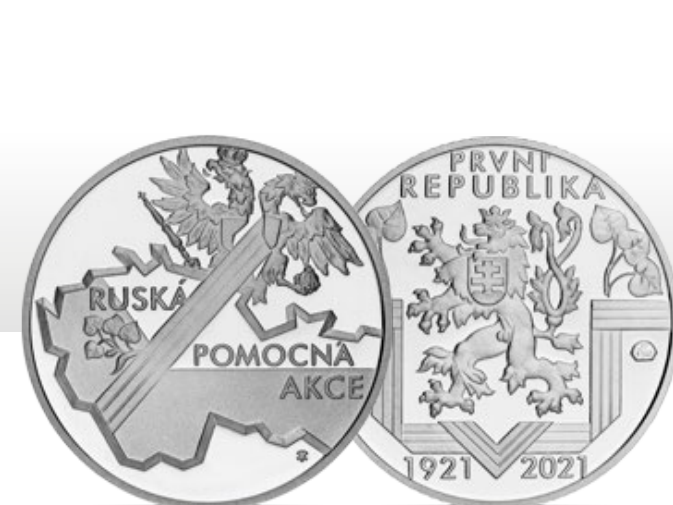
Dukát průměru 19,75 mm